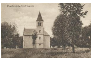
A valamikori Szondi-kápolna Drégelypalánkon

A bét három vonala jelentheti az igeolvasást, az imádságot és a jótékonytságot is, a világ három pillérét; mikor ezeket teljesítjük, házat építünk az Örökkévalónak... Tegyük meg!