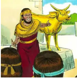
Jeroboám király az aranyborjával

nézünk ki mi is: ott mindkét országrész gonoszul cselekedett (a déli, elvileg az igaz vallás központjával bíró országrész is gonosz, bálványimádó lett (Királyok 1. könyve 14. rész 22. verstől); hasonlóan vagyunk nemkeresztény ország és nemkeresztény ellenzék.